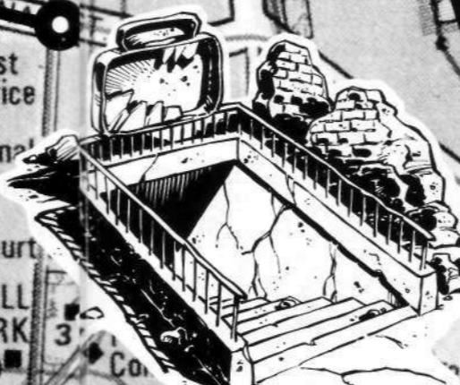
ESTACION 1-2-5 LINEA 1