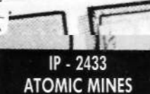
IP-2433 ATOMIC MINES