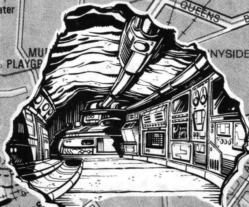
BASE DEL PROFESOR McJERIN