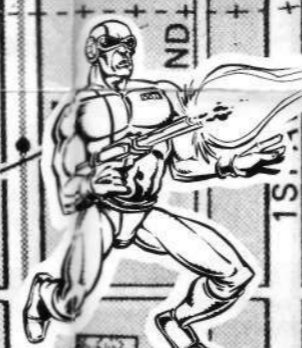
ANDROIDES DE COMBATE «GUARDIAN MW-N»